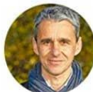
Luc Foucault Maire de Séné, Président de l'ARIC (Association régionale d'information des collectivités)